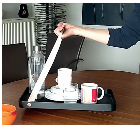
Tablett von Stelton

Alle Infos und ein Video findet Ihr, wie immer, auf unserer Homepage unter: