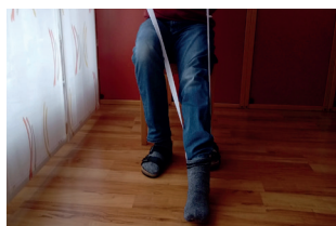
Sockenanzieher mit Frottee, von diversen Herstellern