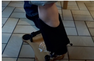
Sockenanzieher „Hand & Fuß“ von PBInnova